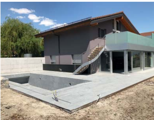
Aménagements extérieurs et piscine en béton.